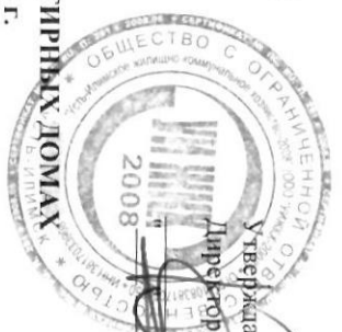
ГРАФИК ТЕХНИЧЕСКОГО ОБСЛУЖИВАНИЯ КОЛЛЕКТИВНЫХ ПРИБОРОВ УЧЕТА ХОЛОДНОЙ ВОДЫ В МНОГОКВАРТИРНЫХ ДОМАХ (деревянные дома брусчатой конструкции) на 2023 г.